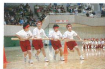
走って！回って！跳んで！

人による「集団の美」を見せてくれました。「徒競走」「百足競走」「台風目」に続いて、2・3年生による「棒引き」「綱引き」です。1年生が声援を送る中、全力で取り組み、大いに盛り上げました。午前中の演技を締めくくるとは「クラス対抗大縄跳び」です。練習していたフロアでの縄跳びに、どのクラスも苦戦しましたが、時間ぎりぎりまで一生懸命に跳びました。今年の最高記録は2年B組の30回でした。午後は、応援歌披露から始まり、3年生の体育委員が作成したものです。日新館の新たな伝統となる応援歌を生徒全員で堂々と披露しました。