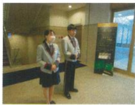
ステーションホテル 小倉

僕は奥野農園へ職場体験に行きました。3時間ほど種まきを行いました。やる前は「種まきなんてすぐできる。もっと他の仕事したい。」と考えていたのですが、実際にやってみると難しく、種が多すぎたり、暑さや虫で集中が途切れたりと苦戦