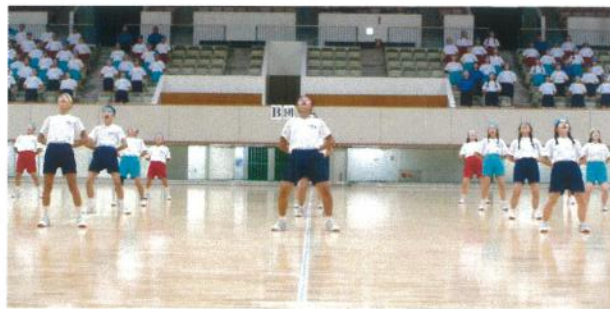
心をひとつに！応援歌披露

10月2日(水)、体育会を実施しました。今年創立50周年を記念して北九州市立総合体育館で行い、雨天でしたが無事に開催することができました。平日にも関わらず、多くの保護者の方々に来場していただき、盛大な体育会となりました。本番までの2週間、残暑が厳しい中、生徒は演技や応援の練習に真剣に取り組みました。応援団員や体育委員、その他各係の役員は、放課後の時間などを使って打ち合わせや練習を重ね、校内では体育会に向けての熱気が徐々に高まってきました。