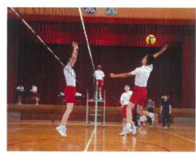
3年選抜チーム 試合の様子